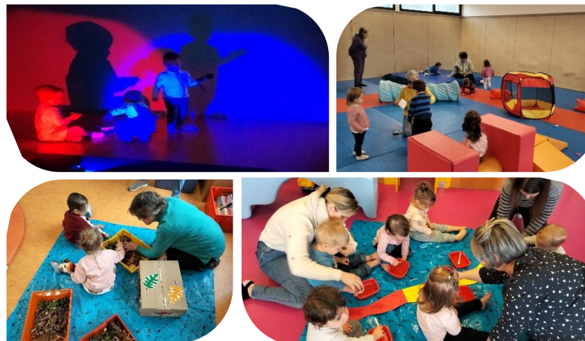
Quelques photos du trimestre précédent