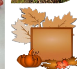
Quelques photos du trimestre précédent