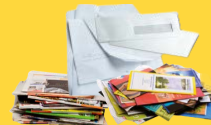
Journaux, magazines, prospectus, catalogues, enveloppes, courriers, cahiers