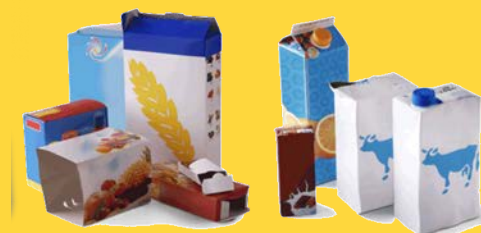
Cartonnettes Briques alimentaires