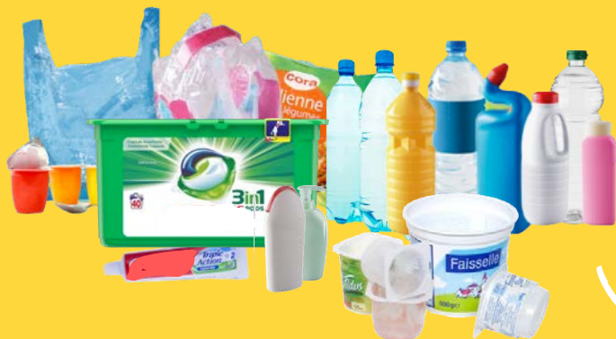
Bouteilles, flacons, pots, barquettes, tubes, emballages souples