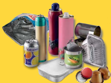
Emballages métalliques même les plus petits