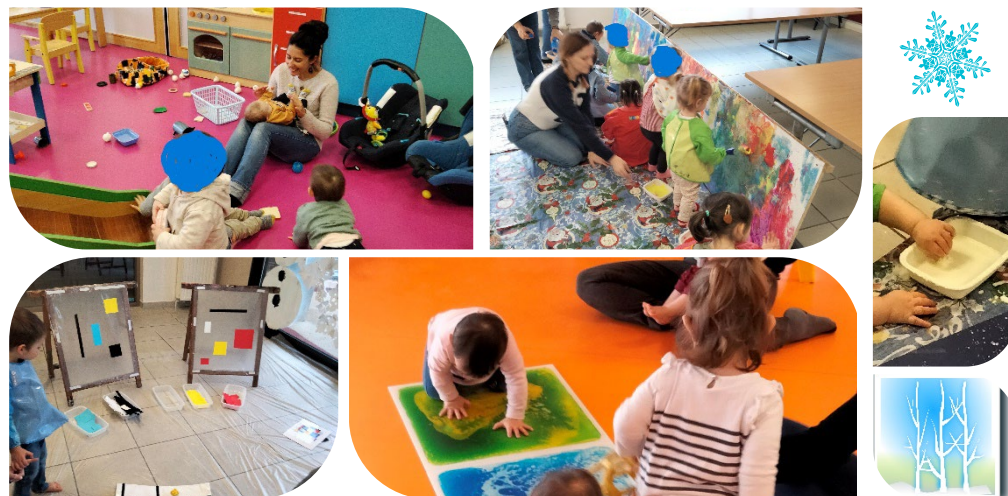
Quelques photos du trimestre précédent

Programme des Animations Avril à Juillet 2024